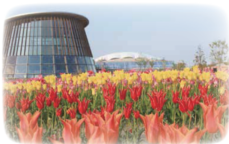
新潟市 食育・花育センターとビッグスワンスタジアム

「一人は万人のために、万人は一人のために」という協同組合精神の基本理念に基づき、信用事業を通じて、新潟県農業の振興および農家経済の安定・向上を図るとともに、広く地域社会の発展に貢献します。