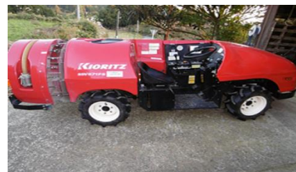
にいがた農業応援ファンドを活用し、効率的な作業のための機械を導入

中でも、柱となる事業の一つである「にいがた農業応援ファンド」について、令和4年度は、「新潟県園芸振興基本戦略」の取組みを新潟県および関係機関と一体となって一層推進していくため、「1億円園芸産地チャレンジ事業」の助成枠を拡充しました。また、「園芸生産拡大支援事業」および「新規・親元就農応援事業」を継続し、農業者の取組みを支援しました。