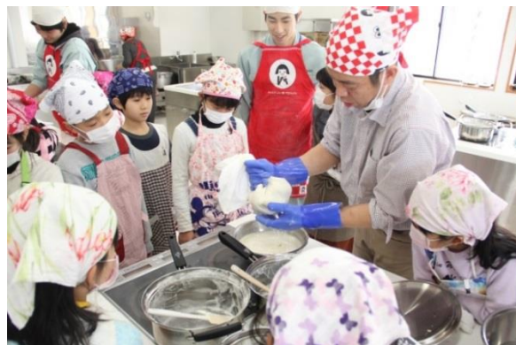
「食農教育活動の様子」