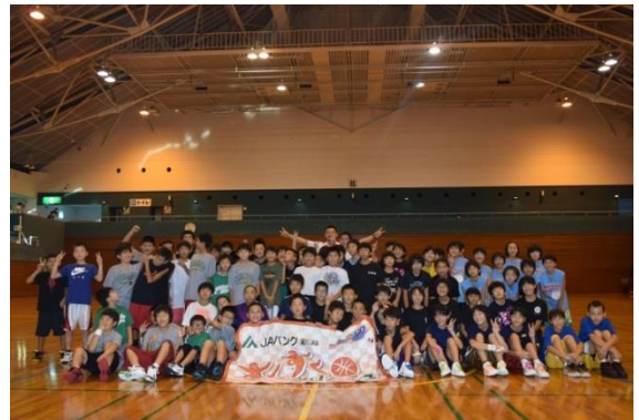
「新潟アルビレックスBBの選手によるバスケットボール教室・食育教室の様子」