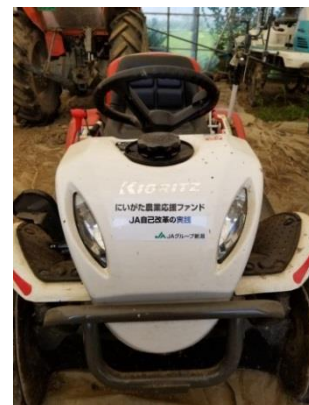
「農機具等の取得応援事業を活用して導入した農機具」

その中の施策の一つである「にいがた農業応援ファンド」では、直面する課題の克服にチャレンジする担い手（個人・法人を問わない）のあと一歩を応援するため、農業生産の拡大、農産物の加工・流通・販売の促進および農業を通じた、地域活性化に必要な資金の一部を助成しています。