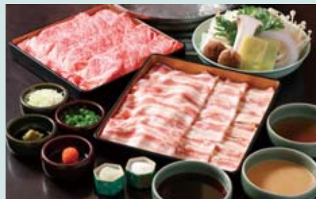
特選村上牛と妻有ポークの食べ放題コース 新潟県産をはじめ、国産野菜の盛り合わせ、きしめん、餅が含まれる。