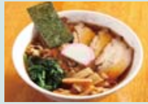
妻有ポークのチャーシューメン