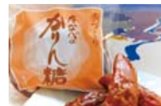
材料は全て無添加・無着色。油にもこだわり、精製しない絞りをたての菜種油を使用。通常、かりん糖は白砂糖を焦がして色付けするが、「たなべのかりん糖」は黒砂糖をたっぷり使った自然の茶色に仕上げている。