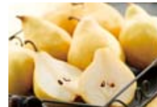
豊富な香りととろけるような食感が特徴の「ルレクチエ」