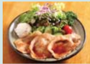
妻有ポークの生姜焼き定食