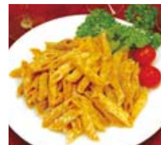
お土産におすすめの「マカロニチップス(315円)」。加茂土産物センターや「はすたみすた」で購入できる。

国産マカロニ発祥の地、加茂市。明治四十一年、横浜の貿易商が市内の製麺所に「穴のあいた麵」と依頼。苦心のすえ独自に製造機を発明し、製造をスタートさせたのが始まり。当初は「穴あきうどん」と呼ばれていた。現在、市内約10店舗で独自のマカロニ料理が提供され、マカロニチップスやマカロニ入りシュークリームなどの変わり種も。信濃川沿いの肥沃な土地では明治初期から果樹栽培が盛んに行われ、栽培面積、出荷量ともに県下屈指を誇る。