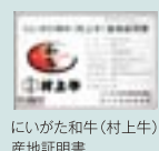
にいがた和牛(村上牛)産地証明書