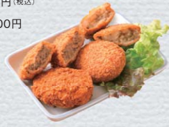
村上牛ジュシーメンチカツ 350円(税込) 村上牛手作りコロッケ 180円(税込)

※他に最高級A-5サーロイン御膳 8,500円 サイコロステーキ御膳 2,800円など