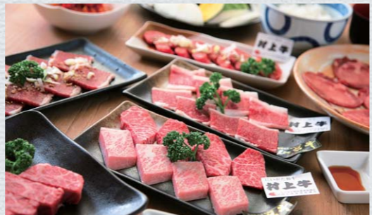
贅沢食べ比べコース 1人前 4,500円(税込)

最高品質の和牛をリーズナブルな価格で提供する「豚牛」では、村上牛と仙台牛の「贅沢食べ比べコース」が楽しめる。コース名通り、二種類の厳選した高級和牛の、とろけるような霜降りカルピ、ロース、厚切りサブトンといった部位をそれぞれに心ゆくまで堪能でき、野菜や卵、米も、産地や調理法にこだわって提供している。スタッフによれば、特選牛を探るため、遠方から健啖家がとびきりの味を求め、訪れるという。